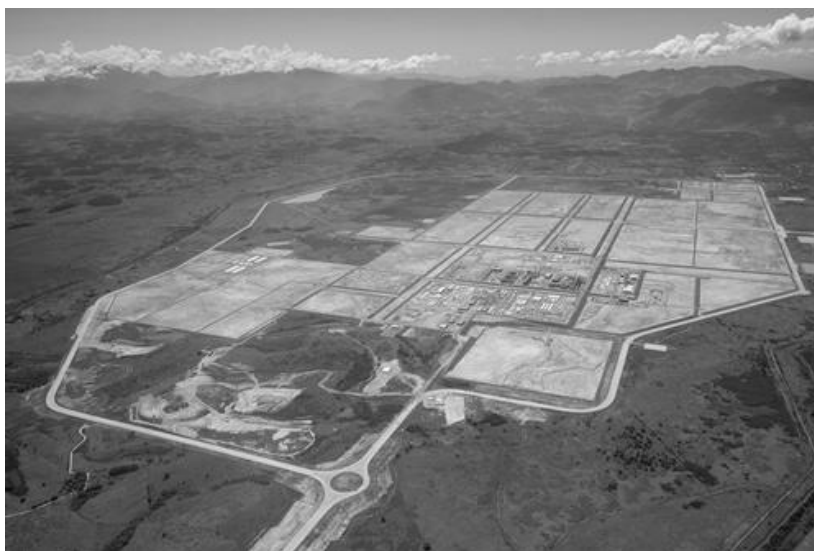
Figura 2. Área construída do COMPERJ

Referente à construção do COMPERJ (Figura 2) o governo federal escolheu o município de Itaboraí – RJ por estar também em uma posição estratégica, perto simultaneamente do município de Macaé – RJ onde se concentra praticamente toda a estrutura de produção do petróleo e também dos grandes centros de refino, distribuição e consumo do estado.