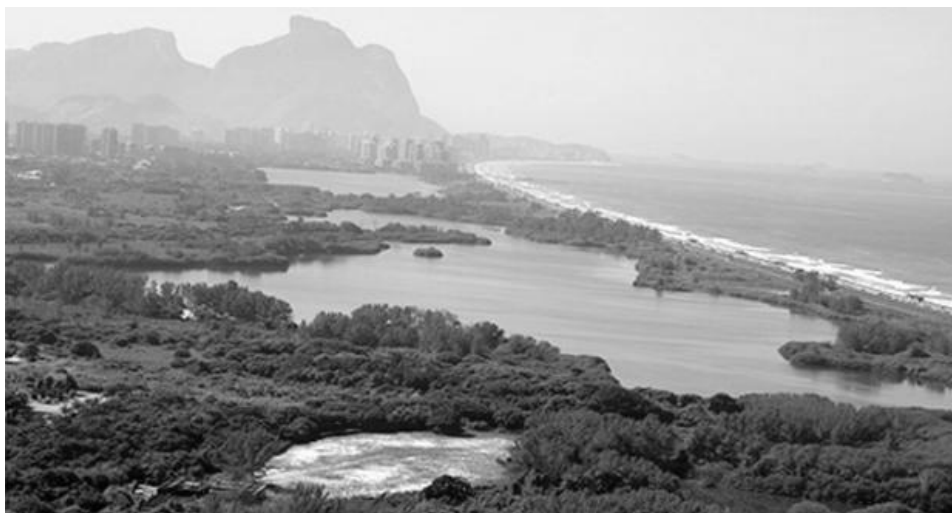
Figura 3. Área construída do COMPERJ

A figura abaixo (Figura 3) mostra a área da APA de Marapendi margeando o litoral da Barra da Tijuca em sua atual formatação.